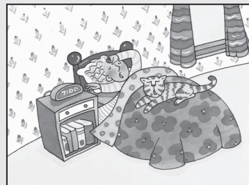
Son las 7:00. ¡A despertarse!