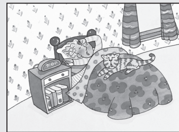
It's 7:00. Time to wake up!